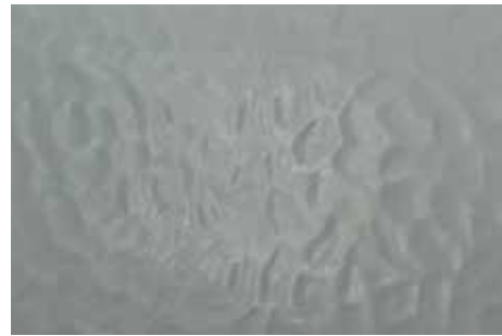
UF 13 N